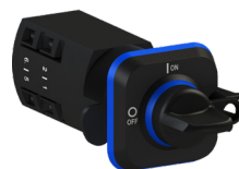
Conmutador de levas