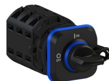
Conmutador de levas