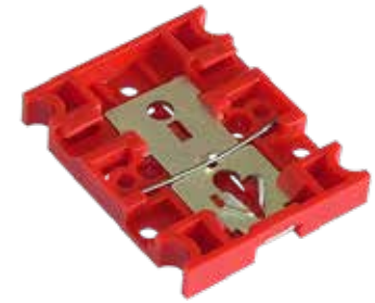
Schnappbefestigung Snap-on mounting