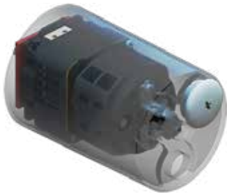
Schutzhauben Protecting covers