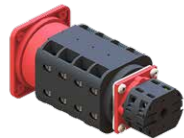
Schalterkupplung Switch couplings