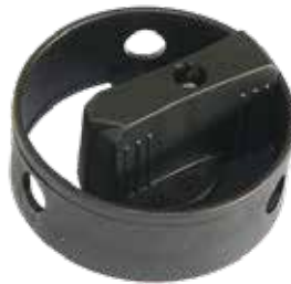
Sperrgriff mit großem Ausschnitt Locking Handles with large cutout