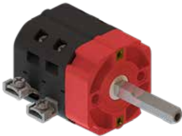
Anschlußwinkel Extension terminals