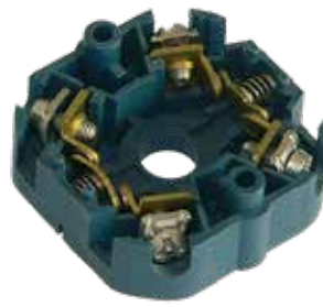
Vergoldete Kontakte Gold plated contacts