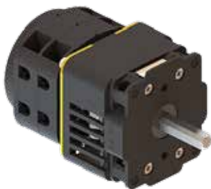
Unterspannungsauslösung USPA Undervoltage release UVR