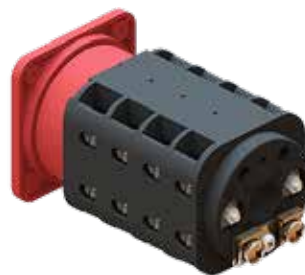
PE-Klemme - N-Klemme PE-terminal - N-terminal