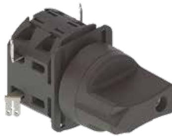
Flachstecker Blade terminals