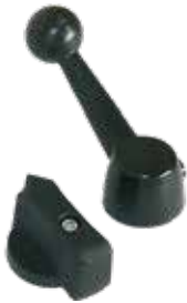
Knebelgriff P / Kugelgriff K Handles P / Spherical handles K