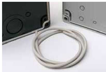
Dichtungssatz I1-I3 Back Panel Gasket I1-I3