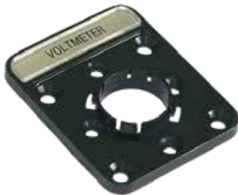
Zusatzfrontschild Additional front plates