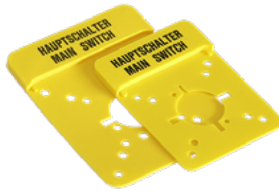
Zusatzfrontschilder - gelb Additional front plates yellow