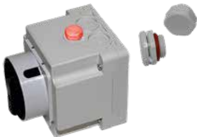
Druckausgleichselement Pressure balance element