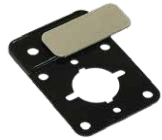
Zusatzfrontschild Additional front plates