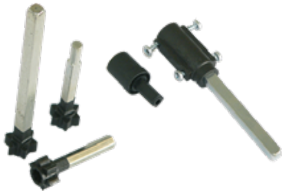
Stahlantriebsachse / Achsverlängerung Steel-axle-shaft / Extension shafts