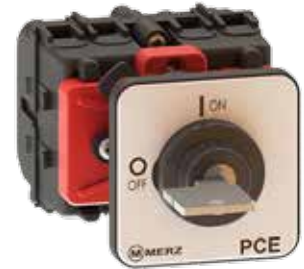
Schlüsselbetätigungen Key operation