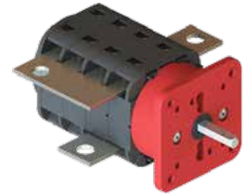
Hochstromverbinder Heavy current connectors